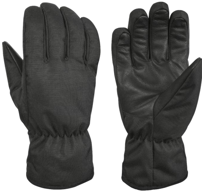
EMILY POLICE Gauntlet Black

Winterhandschuhe für Polizei und Sicherheitskräfte.